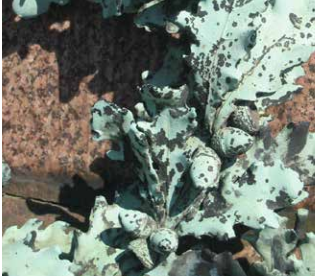
De eik symboliseert vitaliteit en een lang leven