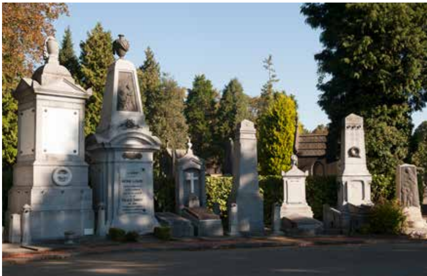
De centrale rotonde

De hoofdassen van de begraafplaats begrenzen de meestal driehoekige perken, die ongelijk zijn van oppervlakte. De rechtlijnige lanen tekenen de algemene vorm van het domein, terwijl de golvende lanen panoramische uitzichten en wijde vergezichten bieden die uitnodigen om er te wandelen en tot rust te komen. De kruispunten zijn zo ingericht dat de grafmonumenten op de hoekpercelen goed tot hun recht komen.