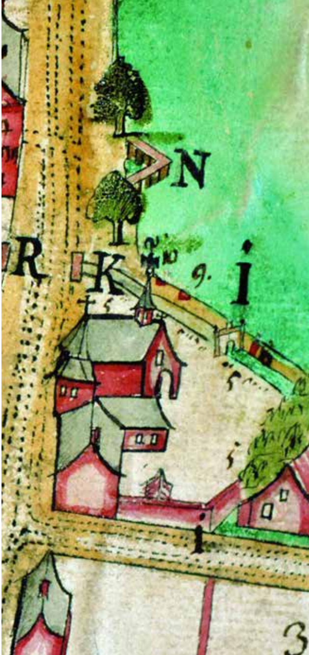
De Heilig-Kruiskapel rond 1750

Elsene is op dat moment een van de voorsteden van Brussel en strekt zich uit tot voorbij de Naamsepoort, die werd afgebroken aan het einde van de 18de eeuw. Vanaf de 16de eeuw werden de overledenen begraven in de buurt van de Heilig-Kruiskapel, dicht bij het huidige Eugène Flageyplein, naast de vijvers. Om de hierboven genoemde redenen krijgt het parochiale kerkhof een nieuwe bestemming. Bovendien wordt Elsene in 1832 getroffen door een cholera-epidemie. Er zijn bijna 250 doden. In 1834 opent de gemeente een burgerlijk kerkhof aan het kruispunt van de Burgemeesterstraat en de Boondaalsesteenweg.