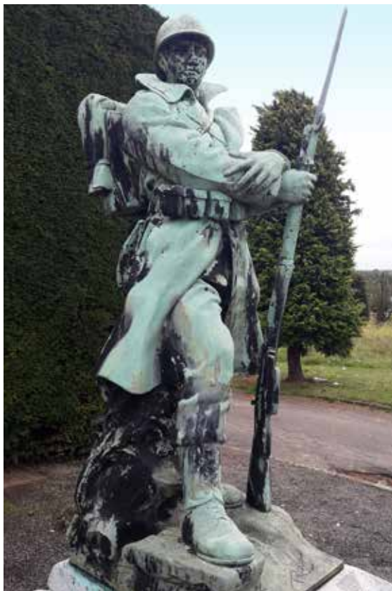
Dit standbeeld is het werk van Marcel Rau.